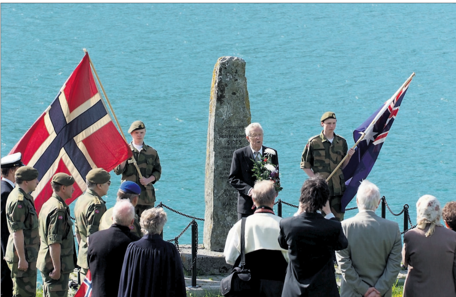
Bauten på Lianeset. Kransenedlegging 17. mai 2008.

ka att. Det vart reist eit minnesmerke på Lianeset.