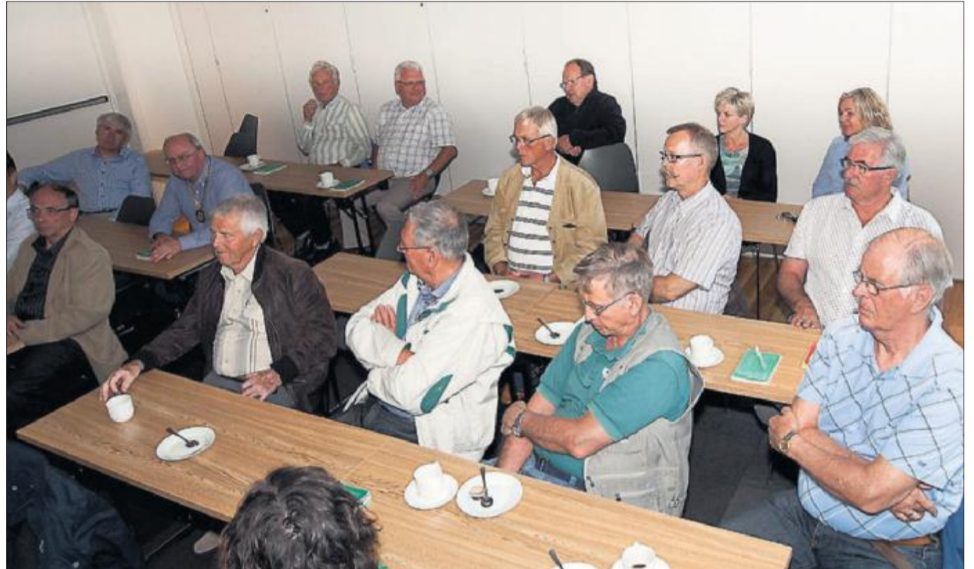
Medlemmene i Ørsta Rotaryklubb stilte spørsmål ved om den tradisjonelle industrien er liv laga i Ørsta.

På plassane deretter kjem transport (300), landbruk (195) og eigedom/service (150). Landbruket har fått halvert mengd personar som driv siste ti åra, men Ørsta er framleis